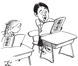
「響三くん、それで本当に読めるの？」 ウルシ・ヒロ

だらけです。弱いものいじめの小泉政権もう沢山です。やめて・・・九月には終わらない継続されるからです。