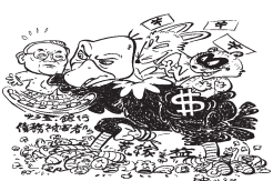
「悪い、金利を下げるなよ」—サラ金の土曜金利で夜か 白川たかし

厚生年金保険料九月分からまた値上げ サラリーマンが加入する厚生年金の保険料が、九月分から引き上げられます。二〇〇四年に自民・公明両党が強行した年金改悪によるものです。引き上げは、十月給与と天引き分から実施されます。(労働者本人の保険料率七・三二一% 給与+賞与で、平均年収五七〇万円 で約一万円負担増)