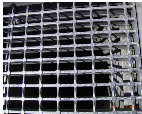
西友前の通り（改善後のグレーチング）

当時赤旗日曜版読者の家庭の旦那さんが、前年の大雪の雪かきで屋根から転落、車イスの生活になってしまいました。車をよけるため道路の端に寄ると、車イスの前輪がグレーチングの粗い目に丁度落ち込んで、難儀をされる話をお聞きしたのがきっかけでした。最初の六月議会的一般質問にこれらを取り上げて、実現したのがグレーチングのフタの編み目の改善です。