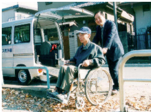
段差解消第1号加美平北公園にて実地検証

レーチングと称される鋼製の網ふたが設置されており、この上を車いすが通行する際にタイヤが挟まってしまつたので改善をとのことでございます。このいわゆるグレーチングは道路上の雨水を雨水管に取り込むためのもので、市内の至るところに設置をいたしております。今後は現地をよく確認させていただきませんが、基本的には道路の改良等にあわせ、また病院や公共施設等の周辺を優先的にし、よりよきものに改善できればと考えているところでございます。なお、本年度におきまして東京都福祉のまちづくり条例に定める道路の現況調査を予定いたしておりますので、この中でも調査項目として考慮してまいりたいと考えておりますので、御理解のほどお願いをいたします。