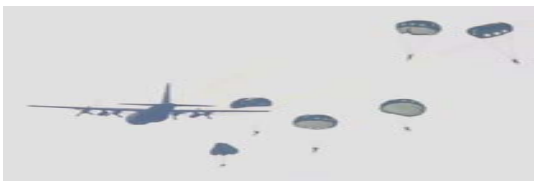
2月10日100人規模 横田基地落下傘降下訓練