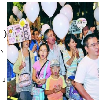
(写真)「大飯原発再稼働反対」「大間原発をつくるな」と声をあげる人たち = 12日、首相官邸前

「今すぐ原発ゼロに」「大飯原発停止せよ」。首都圏反原発連合が呼びかける首相官邸前抗議行動が12日、官邸前と国会・霞が関周辺でおこなわれ、参加した2万人（主催者発表）が唱和しました。誰でも安心して参加できる行動をめざして、6月から設置されたファミリーブロックには、しゃぼん玉で遊ぶ小さい子どもの姿も。「子どもを守ろう」「原発いらない」と声をあわせました。