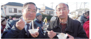
第70回横田基地の撤去を求める集会 休憩時間に、お汁粉が振舞われた