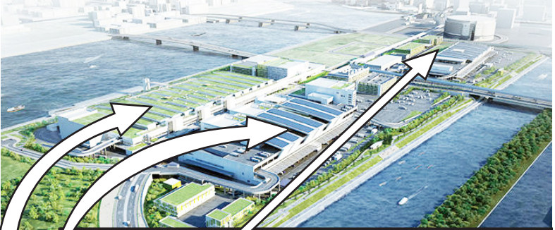
▼豊洲新市場のイメージ図

豊洲新市場の建設費が当初計画から1.6倍に膨れ上がっている問題について、日本共産党都議団は10月5日、都議会本会議の一般質問で「大手ゼネコンとの談合疑惑がある。徹底調査・検証を」と求めました。