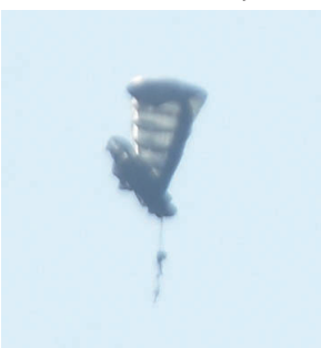
横田基地で2019/1/8 AM10頃 パラシュート訓練中事故発生

「横田基地で2010～17年、泡消剤が3,161リットル以上漏出。土壌汚染の恐れ」報道等の内容を問う